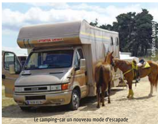
Le camping-car un nouveau mode d'escapade