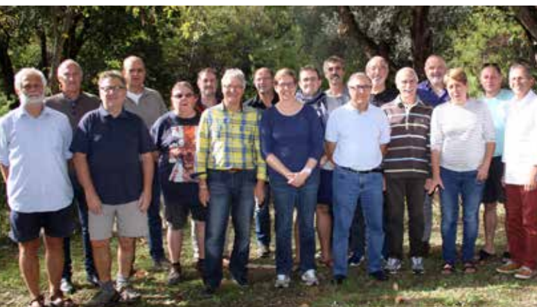
Le nouveau CA

L'assemblée générale 2017, qui célébrera les 80 ans du GCU, se tiendra à LA TRANCHE-SUR-MER, le vendredi 25 août