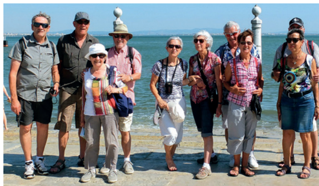
Rassemblement camping-caristes de printemps Portugal