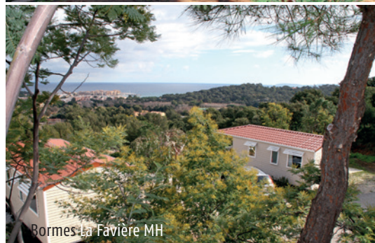
Bormes La Favière MH