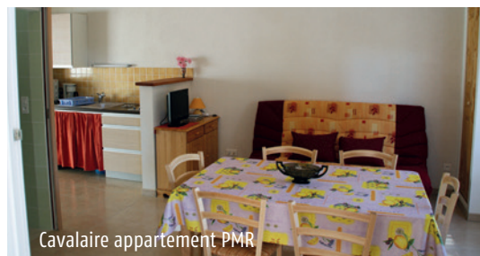
Cavalaire appartement PMR

Pour toute demande particulière, consultez le secrétariat.