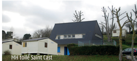
MH toilé Saint Cast