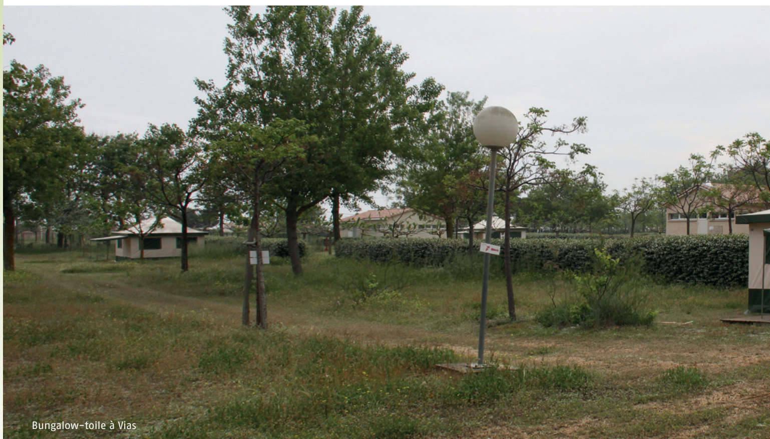
Bungalow-toile à Vias