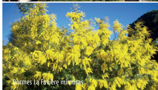
Bormes La Favière mimosas