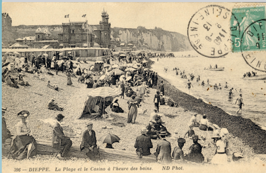
396 — DIEPPE. La Plage et le Casino à l'heure des bains.