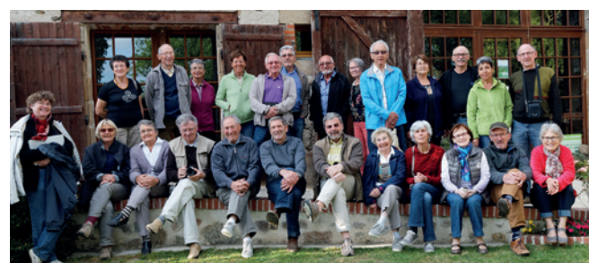
Rassemblement camping-caristes de printemps Hérissou devant la ferme auberge de la Quéoule